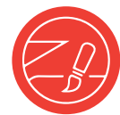
impresión en sándwich