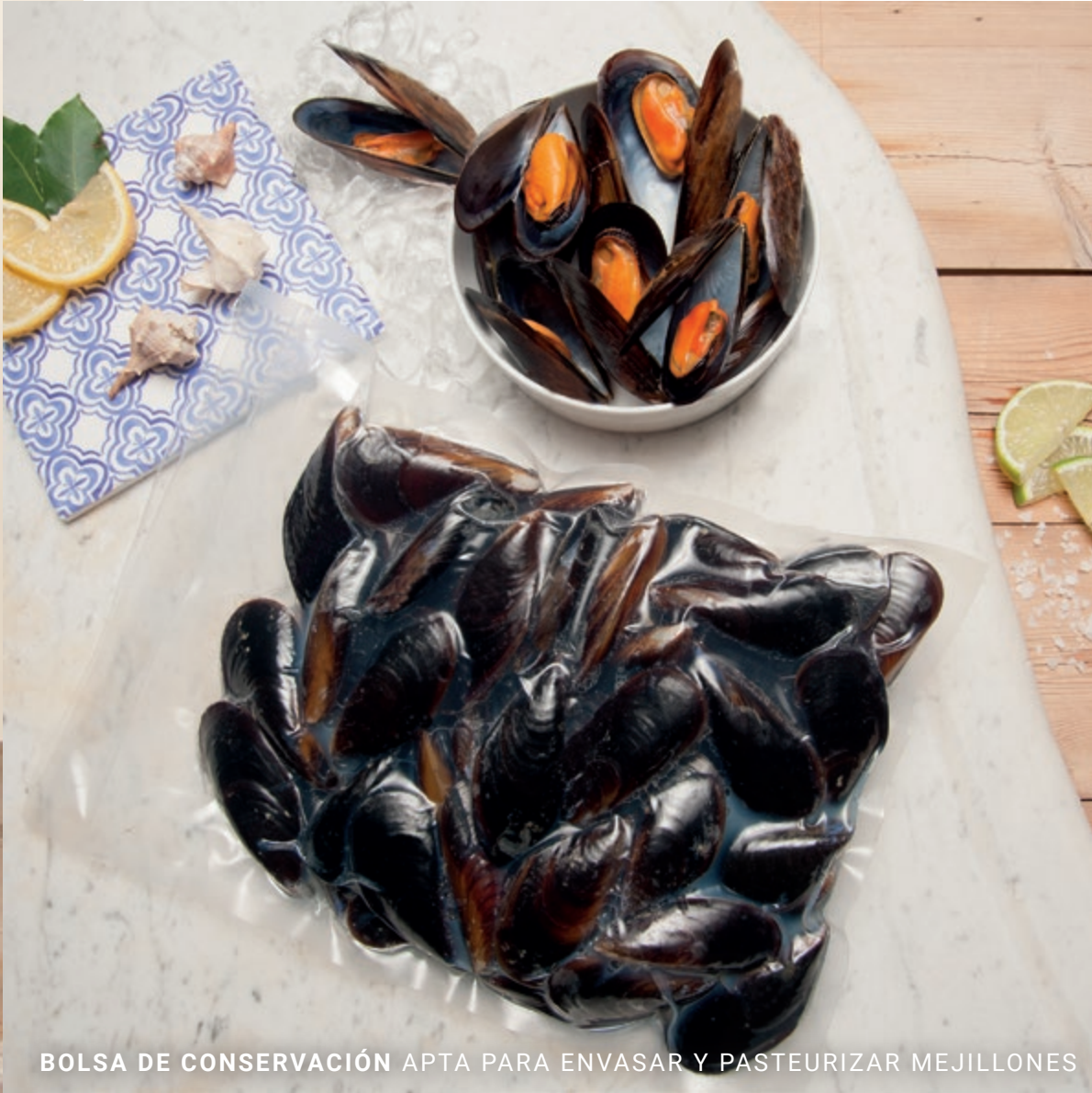
BOLSA DE CONSERVACIÓN APTA PARA ENVASAR Y PASTEURIZAR MEJILLONES

Tenemos un material adecuado para su artículo. Gracias a disponer de diversas fábricas en Europa, contamos con muchas posibilidades de laminación en función de lo que se vaya a envasar. Además, la experiencia y el conocimiento técnico de nuestro equipo (tanto sobre materiales como sobre procesos de producción) hacen de los laminados especiales uno de nuestros puntos fuertes.